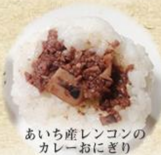
あいち産レンコンの カレーおにぎり

土曜日には本会ブース前で『屋まで待てない!』の生中継も行われ、あぐり父さんがブースで販売している「新米あいち米コシヒカリおにぎり」のPRを行いました。