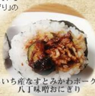
あいち産なすとみかわポークの 八丁味噌おにぎり

番組とコラボした「屋まで待てない! 特選! 新米! あいち 旬の地産地消おにぎりセット」は、あいち産なすとみかわポークを使用した『あいち産なすとみかわポークの八丁味噌おにぎり』、あいち産レンコンを使用した『あいち産レンコンのカレーおにぎり』の2種類の特製おにぎりを限定販売しました。