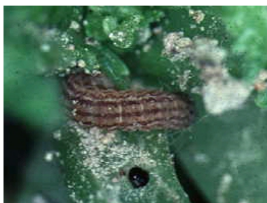
ハイマダラノメイガ幼虫