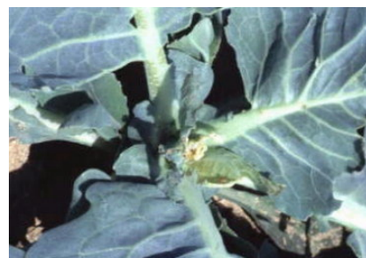
ハイマダラノメイガによる加害