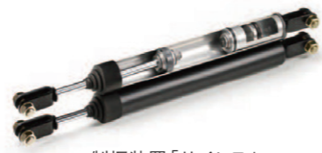
制振装置「サイレス」

大地震にも耐えることができる「システムラーメン構造」を採用し、鋼製パネルと2本のオイルダンパーを組み合わせた制振装置「サイレス」を搭載し、地震の揺れを吸収します。