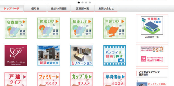
物件検索トップ画面