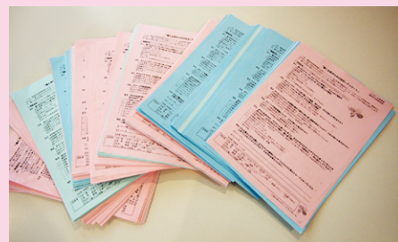
JA女性従業員459名から集めたアンケート

今後はリノベーション等に働く女性が魅力と感じる要素を取り入れ、物件の価値向上を目指します。実物件が完成しましたらハートホーム通信でもご紹介する予定です。ご期待ください。