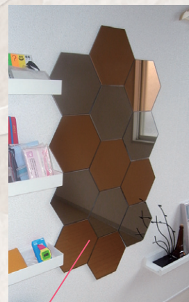
オシャレな姿見鏡