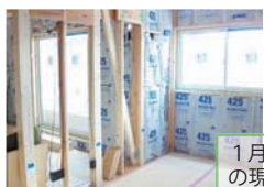
1月10日時点の現場写真