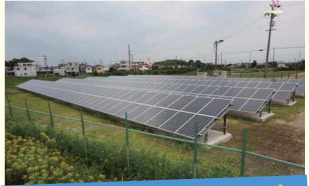
「野立て方式」の設置事例

また、「野立て方式」の場合は施設撤去も容易なため、相続等により引き継いだ次世代が、20年後には現況に戻し、新たな用途に活用することも容易です。そのため遊休地での太陽光発電システム設置は、資産活用の新たな手法として問合せが増えていきます。