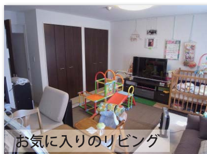
お気に入りのリビング