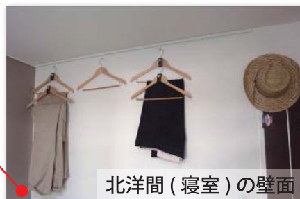
北洋間（寝室）の壁面