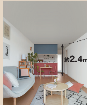
一般的な賃貸住宅の天井高イメージ

2階建ての建物に床面積に算入されない0.5階分の高さをプラス。その0.5階分のゆとりを収納と高天井などに充てています。