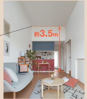
「蔵のある賃貸住宅」の天井高イメージ