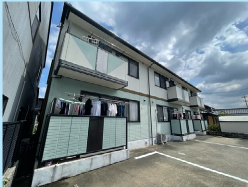
リフレッシュ工事 施工前の外観

建物の塗装は築年数の経過と共に劣化していきます。何気なく過ごしていく毎日、紫外線や強風などの自然現象により塗膜の劣化が進み、建物自体の寿命を縮めてしまう事にも繋がってしまいます。また、色あせた外壁は美観を損ね、空室発生時の募集活動にも支障をきたします。