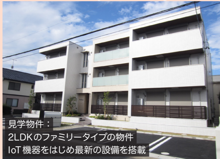
見学物件： 2LDKのファミリータイプの物件 IoT機器をはじめ最新の設備を搭載