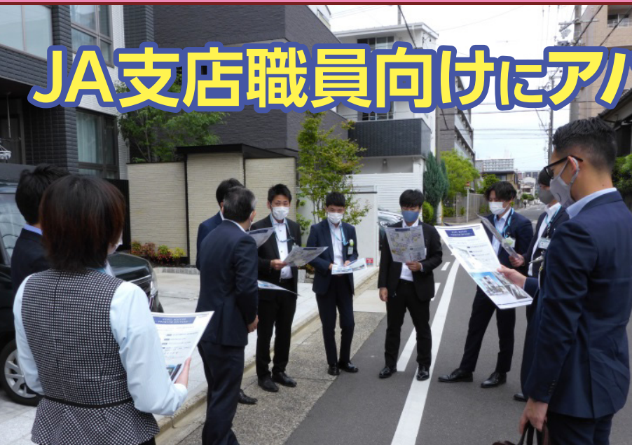
旭化成ホームズ(株)の特徴の一つである外壁(ヘーベル板)について説明を受けています。