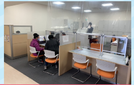
撮影協力：JAあいち知多 大府不動産センター

JAの個別税務相談会では、専門性の高いご質問・ご相談においても税理士をはじめとした税務のプロがその場でわかりやすくスピーディにお応えします。JAグループがコロナ禍においても継続的に個別税務相談会を実施しているのは、直接「会って」「相談して」分かることがあるからです。コロナ禍においても相談会に足を運んでいただける組合員に対して、感染症対策を行いながら要点を押さえて短時間でわかりやすく相談にお応えいたします。