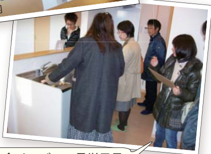
暮らし会メンバー 見学風景