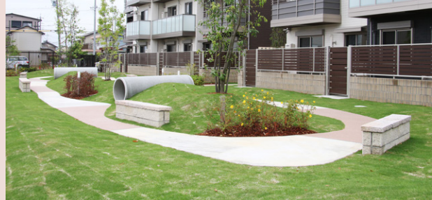
広い共用庭を配置し、生活のなかに緑を取り入れて緑化基準も満たしています。

緑化基準とは市町村ごとに敷地に対して一定の割合の緑化を定めるものです。なかには割合だけでなく、高木何本、低木何本などの細かい規定を設けるところもあり、専門的な知識を要します。植栽を選ぶ際は専門家や設計士の提案内容から選んで頂けると、より安心できます。