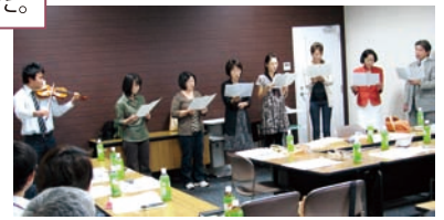
▲ 暮らす会メンバーから歌のプレゼントをいただきました。