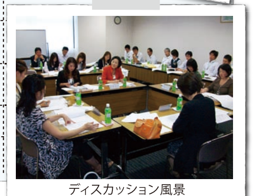
ディスカッション風景